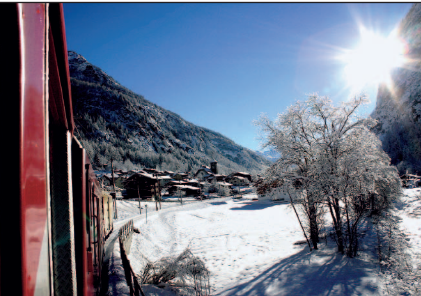
Llegando a Randa en invierno a través de la Matterhorn Gothard Bahn.