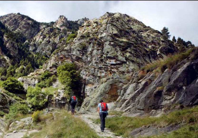
Las últimas rampas antes de llegar a la Creu d'en Riba.

so bosque, dejando a nuestra izquierda la Font de la Ruïra (1.335 m; 30 min). Cruzaremos la Canal Llarga dejando a nuestra derecha la vía del cremallera y la carretera de servicio construida durante las obras del nuevo túnel del Roc del Dui. El camino va ganando altitud progresivamente y pasa junto a la Bauma del Ferrer y un pequeño oratorio. En la Tartera de Corbell (1.457 m; 1 h) encontraremos el desvío hacia Núria a través del Roc del Dui, una posible variante si subimos más veces a Núria y no queremos repetir por el mismo camino. Seguiremos subiendo hacia el Pont del Cremal, pasando por las Escalas de Corbell (1.462 m; 1 h 20 min), donde dejaremos a nuestra izquierda el camino que discurre junto a las vías del cremallera (las obras del nuevo túnel han aportado algunos cambios en el paisaje, ampliando la oferta de caminos y senderos). Pasaremos por la Balma de Sant Pau (a nuestra izquierda) y poco a poco observaremos que el camino va dando un pequeño giro hacia el NO, ganando altitud. A nuestra derecha, observaremos las magníficas Roques de Totlomón. Nos adentramos en la Gorga del Cremal, avanzando cómodamente hasta llegar al Pont del Cremal, un precioso puente de medio punto que