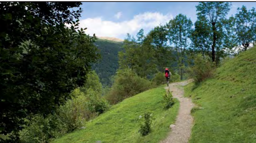
El Camí Vell saliendo de Queralbs.