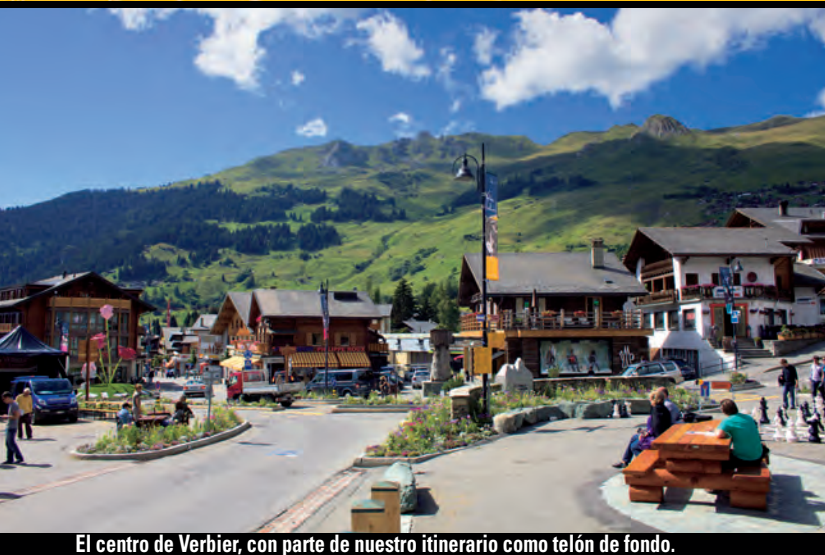
El centro de Verbier, con parte de nuestro itinerario como telón de fondo.

Máxima altitud: Pierre Avoi, 2.473 m. Dificultad: F, PD en el Pierre Avoi con nieve o lluvia. Desniveles: +982 m, -158 m, +39 m, -181 m, +147 m, -830 m. Tiempo: 5-6 h. Recorrido circular. Cartografía: Topo Rando 4 Vallées, 1:25.000.