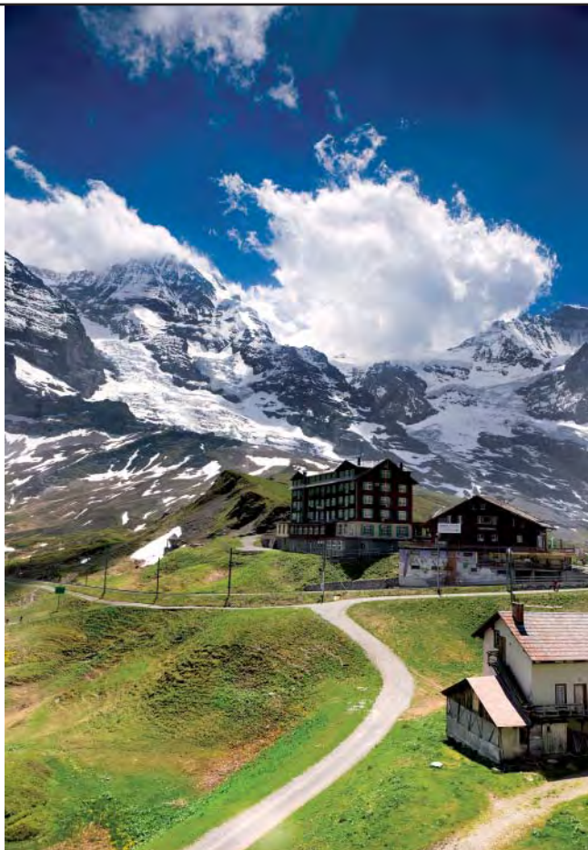
Panorámica desde Kleine Scheidegg, con la Jungfrau al fondo.

donde encontraremos el cartel azul que nos informa de la ferrata. Toda la vía está equipada con cables, escalones y escaleras metálicas, y destaca el punto donde encontraremos uno de los ventanales tapados de la antigua estación del cremallera (fuera de servicio en la actualidad). Si disponemos de tiempo, podemos invertir unas dos horas y media en completar todo el recorrido (subir y bajar).