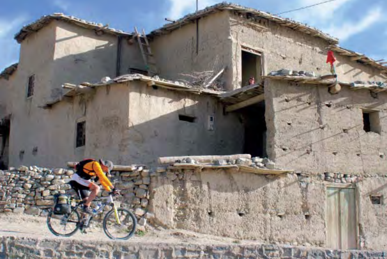
Construcciones típicas en Tagoudit.