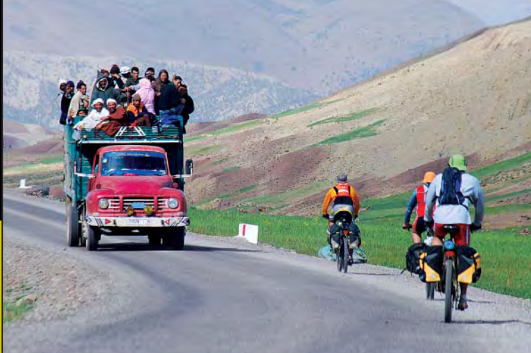
Transporte privado de personas próximo al Tizi n'Siouir.

desapareciendo, ya que con las grandes crecidas el río se la ha llevado por delante. Valoraremos si ha sido época de lluvias, ya que es posible que el río esté crecido e impida el paso en algún que otro tramo. Por lo tanto,