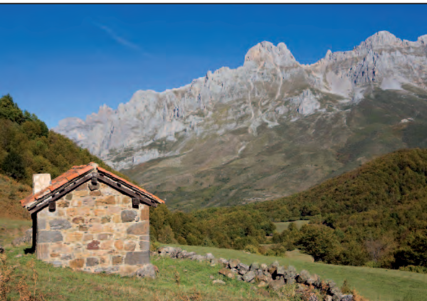
Majada de Brez con el Friero al fondo.

buenas vistas del bosque que hemos atravesado desde Santa Marina de Valdeón y, cómo no, de la torres del Friero, del Hoyo Oscuro y de Salinas, y habremos dado la espalda al macizo del CorniÓN. Tras caminar 15 minutos llegaremos a la majada de Brez.