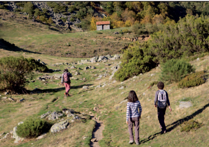
Bajada de Peña Gulugas a la majada de Montó.

hay en la majada de Montó, en un tiempo bastante inferior a las 3 horas que le dan en el cartel informativo en la salida de la ruta.