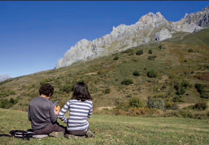
Contemplando la Torre del Frio.

tilla de la Reina. A esta intersección llegaremos por el sur desde Riaño (N-621) o Guardo por la LE-241 y P-215, y por el norte desde el pueblo cántabro de Potes (N-621), atravesando el puerto de San Glorio.