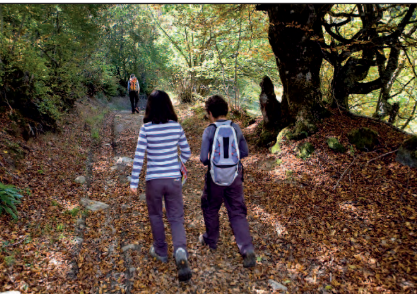
Bosque entre Santa Marina de Valdeón y el valle de Prada.

continuamos una vez más por el ramal de la derecha siguiendo las marcas del PR. En esta parte del itinerario atravesamos el hayedo con grandes ejemplares de haya y roble, así como los sempiternos avellanos y algunos acebos. Seguimos esta cómoda pista durante otros 20 minutos hasta el siguiente cruce de caminos, aunque en éste aún no estamos en la verdadera pista del valle de Prada, sino en otra aledaña. Dejamos atrás esta intersección en la que veremos un poste indicativo y continuamos unos pocos metros siguiendo las indicaciones del PR hasta la pista principal, adonde llegamos apenas uno o dos minutos después.