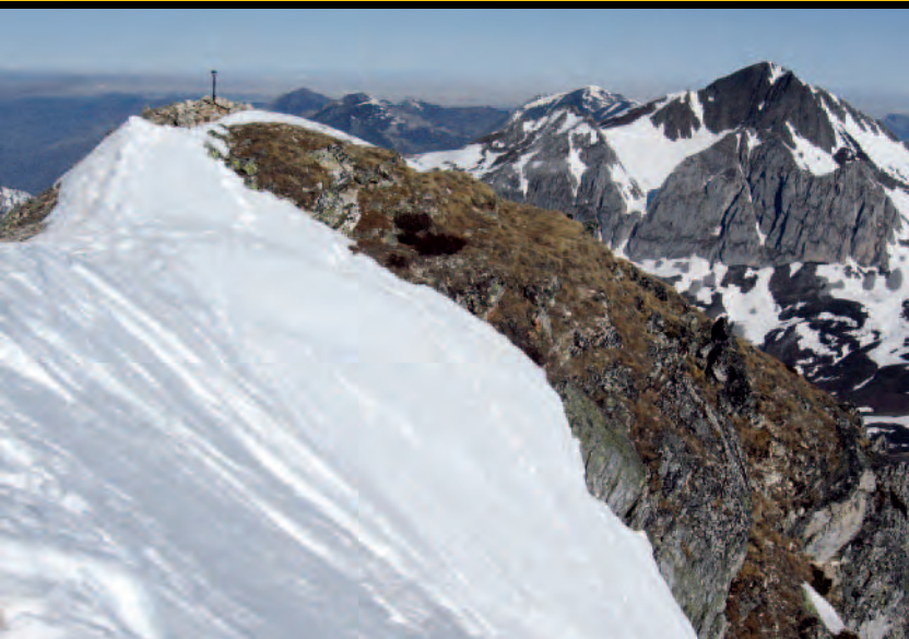
Cumbre del Toneo y pico Torres.

Este núcleo de altivas cumbres ubicado al sudoeste del puerto de San Isidro ha sido igualmente valorado por los responsables del turismo de invierno de León y Asturias como una de las zonas ideales para la práctica del esquí de pista. Hoy día acoge las estaciones de esquí de Fuentes de Invierno y San Isidro, separadas tan sólo por medio kilómetro de ladera en la cabecera de Riopinos, y condenadas a entenderse y unirse si se desea contar con un área esquiable realmente competitiva ahora que la zona ya ha sido totalmente degradada.